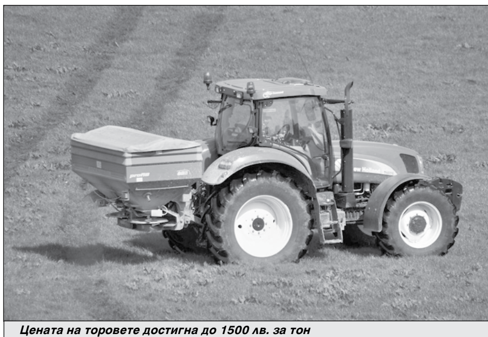
Цената на торовете достигна до 1500 лв. за тон

По негови думи моментът да се вдигне осигурителният праг на фона на енергийната и ковид кризата, а и тази с горивата никак не е подходящ. Той не изключва това, че е необходимо заплати и осигурителни прагове да растат, но не бива това да е рязко.