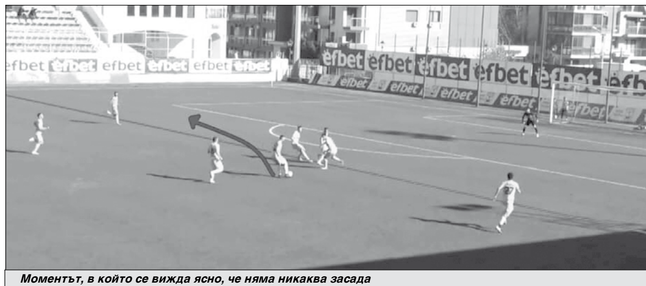
Моментът, в който се вижда ясно, че няма никаква засада