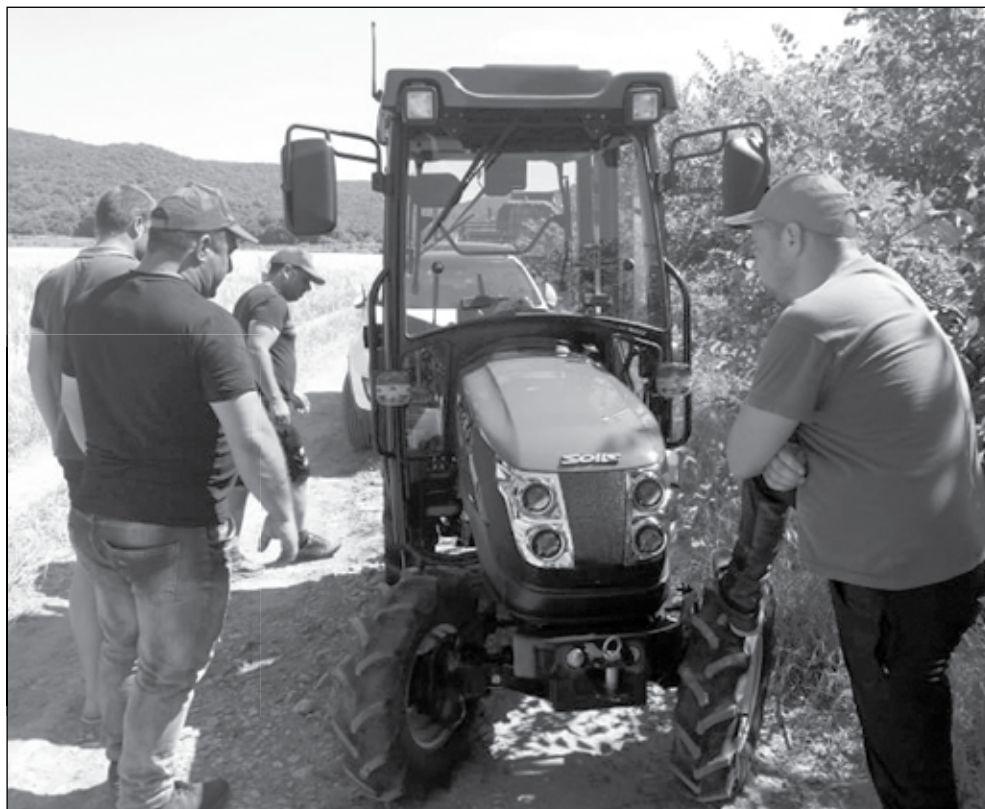
Новата техника винаги предизвиква интерес