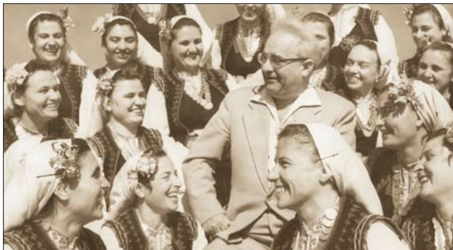
Началото - композиторът Филип Кутев с певци от Ансамбъла

България се гордее с Ансамбъла, а гордостта на Айтос е двойно по-голяма, защото е родно място на създателя му. Уникалният талант и любовта на Филип Кутев и неговите сподвижници към образците на националната ни култура и изключителният професионализъм на Вашия екип вече 70 години опазват и надграждат устоите на българщината. Приемете моите и на гражданите на община Айтос благодарности и поклон за родолюбивото дело, на което сте се посветили!", пише в поздравителния