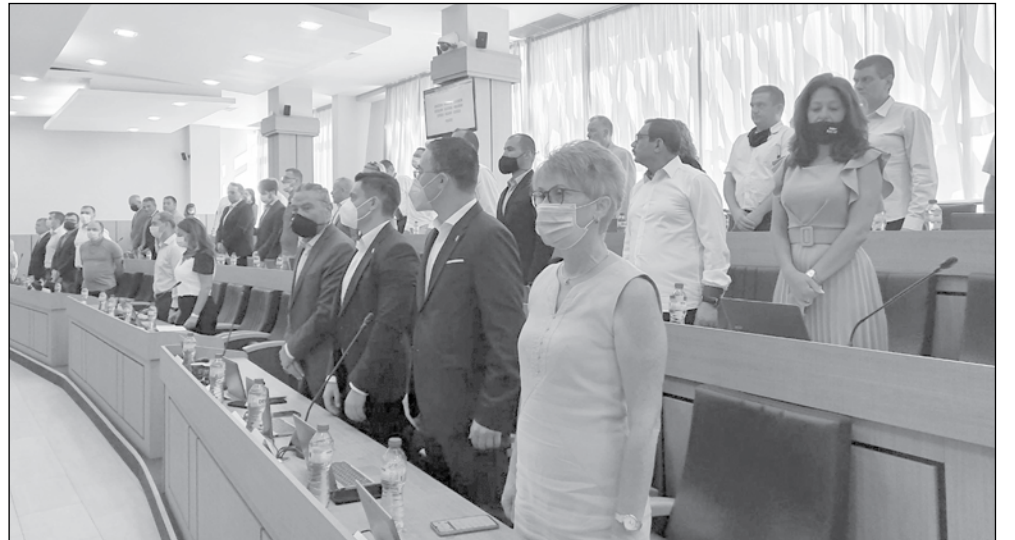
Общински съвет - Бургас предстои да вземе решение по спорния казус

тал „Долно Езерово“, в резултат на извършено разширяване на комбината. Към 1989-а във връзка с възстановяване на собствеността са определени землищни граници, съответстващи на границите към момента на създаване на ТКЗС, тъй като отговарят на тези преди колективизацията. Границата между двете землища е отразена като спорна. Определянето на местоположението на границата е станало с допълнително назначена за целта комисия с актуализация от 1991-ва. Взето е принципно решение да се възстанови границата от 1959-а, т.е. към момента на колективизацията“, се посочва в докладната.