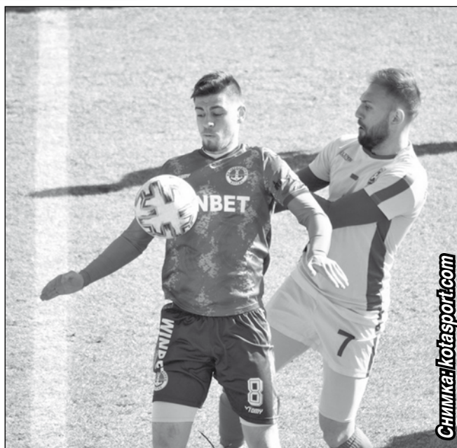
„Черноморец“ победи като домакин тима на „Димитровград“ с минималното 1:0 в мач от 18-ия кръг в третодивизионния футбол