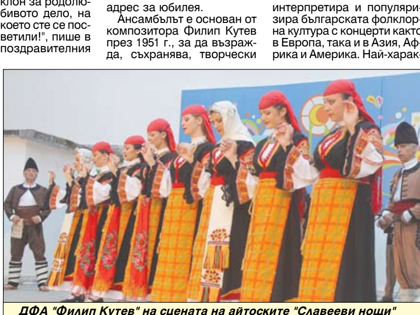
ДФА "Филип Кутев" на сцената на айтоските "Славееви нощи"