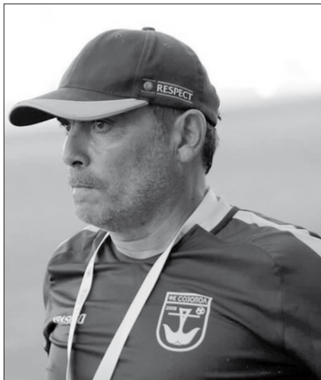
Изпълнителният директор на клуба за пореден път се оплака от лошо съдийство

ма гол за „Созопол“! Последваха шест жълти картона на опитните футболисти – готови и подготвени. Който разбира от играта знае за какво. Е, как е? Как да бъде? Част от играта ли е? За пореден път срещу нас! За пореден път срещу по-скромния отбор, но отбор с достойнство! Това