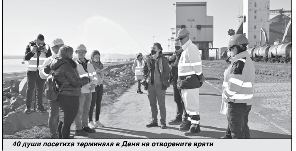
40 души посетиха терминала в Деня на отворените врати

кса за обработка на сярна киселина са вложени 12 млн. евро. Модерните проектни решения и оборудване отговарят на най-високите европейски стандарти, системата за управление и контрол е напълно автоматизирана. Технологичната схема от тръбопроводи (разположени върху бетонови канали с киселиноустойчива изолация), помпи, резервоари и арматура е затворена. Резервоарите са с двойни дъна и котловани, осигурена е възможност за неутрализация на кисели води и