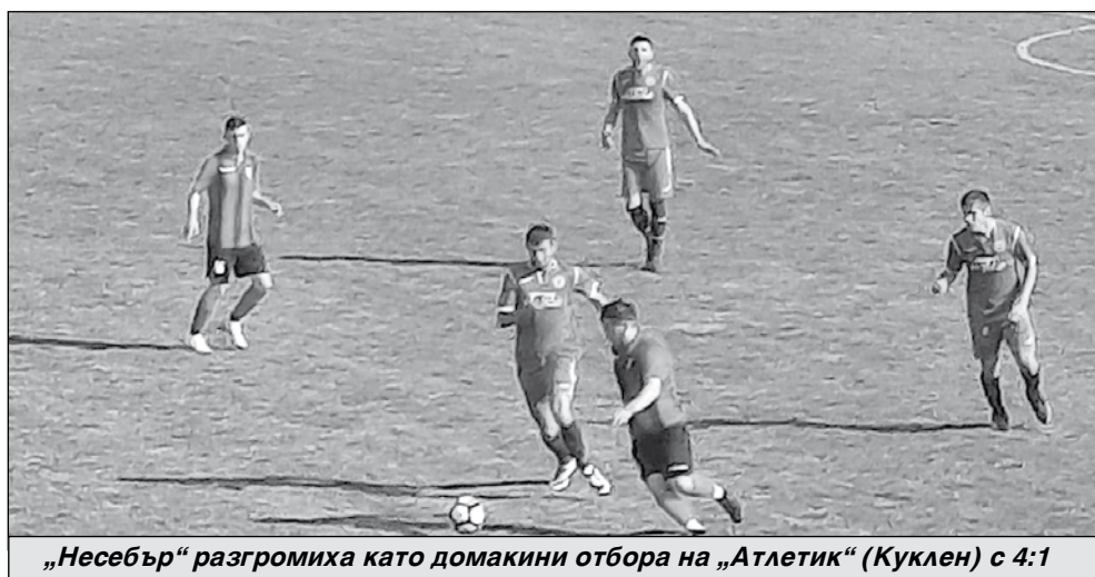
„Несебър“ разгромиха като домакини отбора на „Атлетик“ (Куклен) с 4:1