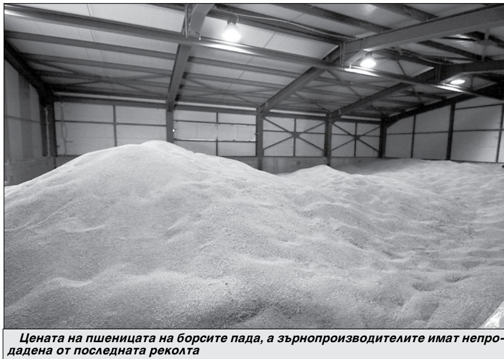
Цената на пшеницата на борсите пада, а зърнопроизводителите имат непродана от последната реколта