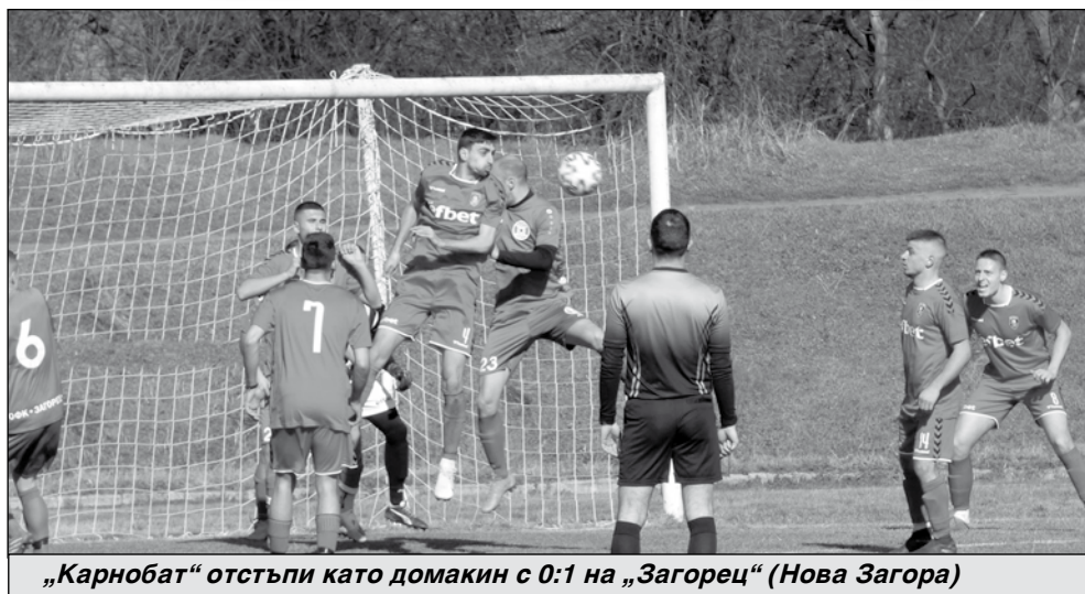
„Карнобат“ отстъпи като домакин с 0:1 на „Загорец“ (Нова Загора)

Така след 18-ия кръг „Черноморец“ е на четвърто място, с актив от 37 точки на 3 от третия „Загорец“ (Нова Загора). „Несебър“ продължава да се изкачва в класирането и заема 14 позиция, с натрупани 19 точки. „Карнобат“ е на 16 място с толкова точки. Карнобатлии са на 6 точки от последния – дублиращия състав на „Локомотив“ (Пловдив).