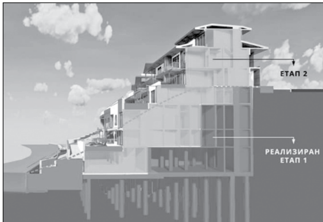
Инвеститорът показва графика, на която се виждат етапите на проекта. Според него първият е изпълнен законно

Той изрази готовност да покаже всички строителни кни-