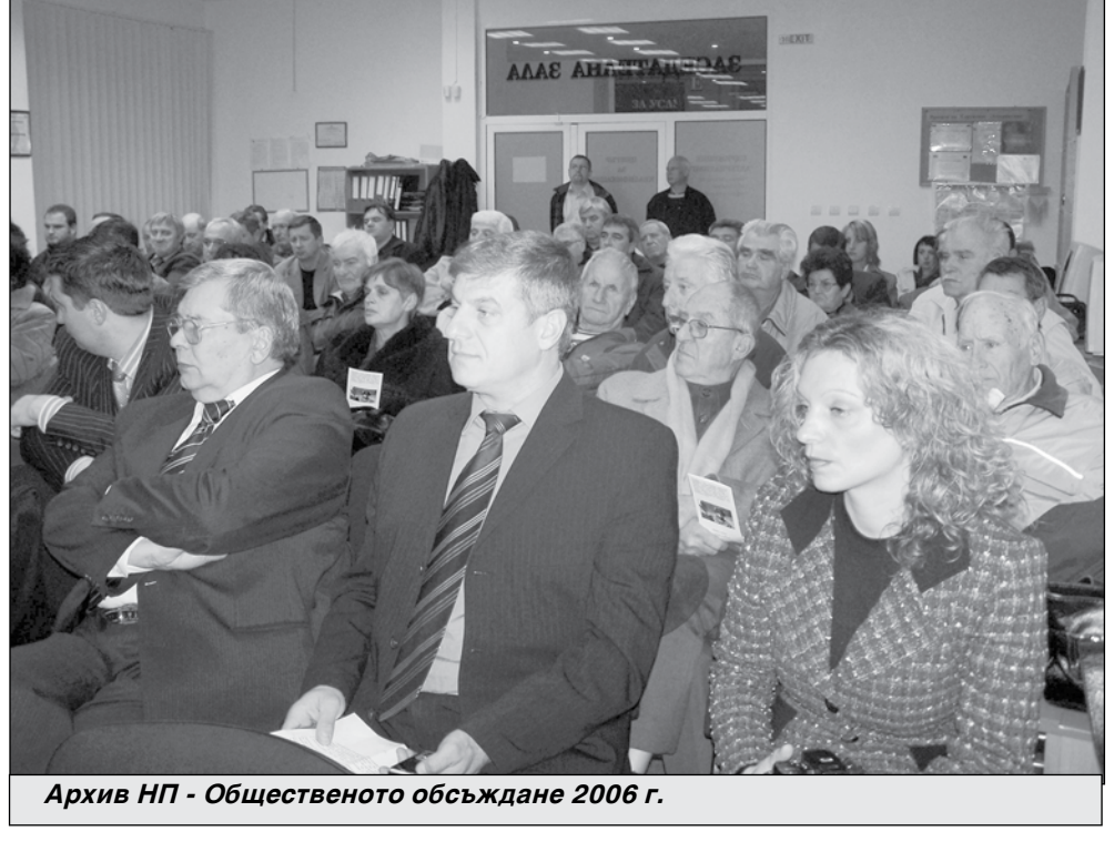
Архив НП - Общественото обсъждане 2006 г.

Според посланик Байърли, САЩ ще инвестират в инфраструктурата, в пътища и жп линии и всичко останало, свързано със съоръженията за подготовка, като инвестициите ще бъдат в