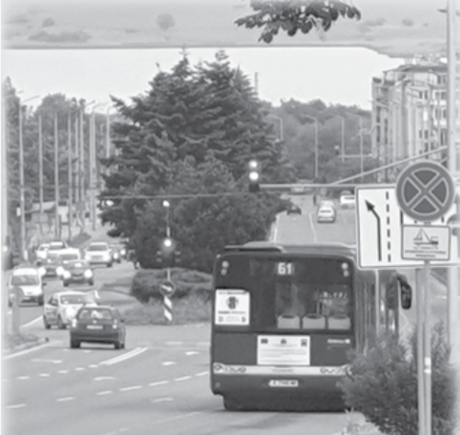
Автобусите от и за комплекса пътуват полупразни

В самите автобуси се вижда също, че никога не са пълни, както едно време се пълнеше автобус 211 например. Когато няма ученици, често в големите автобуси се возят по десетина души.