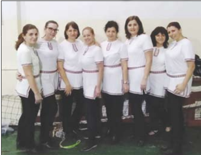
Танцовата група на преподавателите „Вапцаровски ритми“