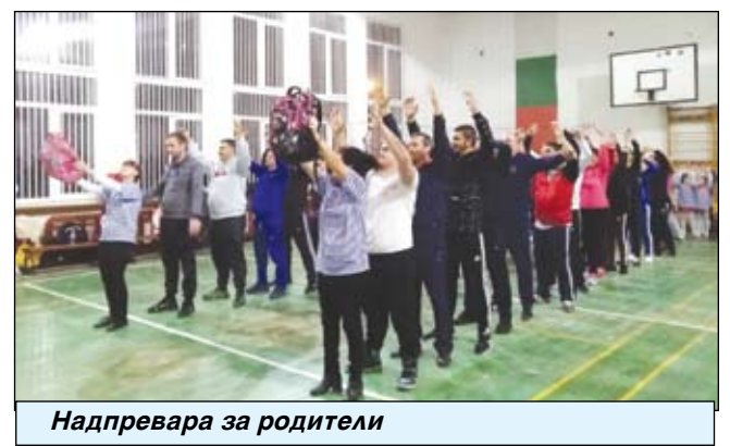
Надпревара за родители