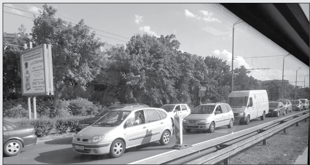
Целта е с кръговите кръстовища трафикът по бул. „Захарий Стоянов“ да не е толкова натоварен

В допълнителен отговор за „Черноморски фар“ от администрацията заявиха, че за кръговите кръстовища има положително решение на Общински съвет - Бургас.