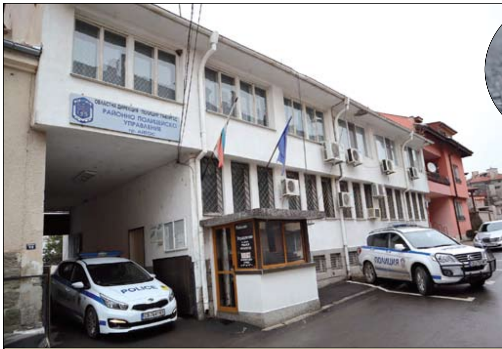
РУ - Айтос

Полицейските служители установили кой е собственикът и му предали изгубената вещ. По неофициална информация, притежателят на ценно-