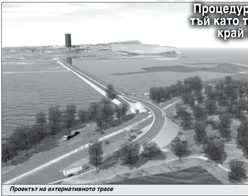
Проектът на алтернативното трасе

на Бургас, с население от около 90 000 жители - предимно младо и работоспособно население. Голяма част от жителите на комплекса работят в централната градска част на Бургас, в пристанищните терминали, летище, в големите търговски центрове и обслужващи зони, в предприятия в индустриалните зони и по Черноморието. Всички зони за труд са на отстояние от комплекса и изискват придвижване с транспорт. Към момента комплексът е свързан с пътища от републиканската пътна мрежа и ули-