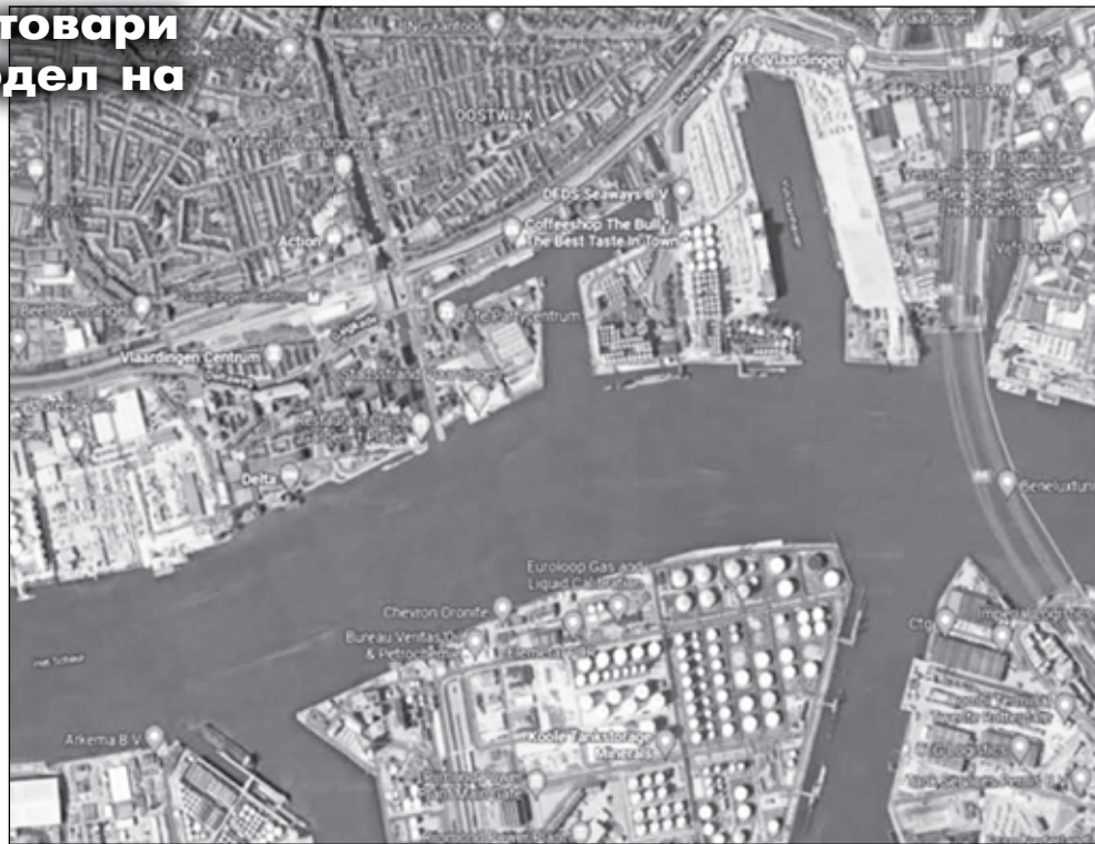
План на пристанище Ротердам, откъдето е видно, че комплексите за съхранение на газ и газьол са разположени в непосредствена близост до центъра на града

нологични причини (приложна ситуация на пристанище Ротердам). Пристанищните съоръжения за обработка на наливни товари са изградени съгласно одобрения от национален междуведомствен експертен съвет Генерален план за развитие на пристанището и са преминали всички необходими съгласувателни процедури с компетентните институции. С цел опазване на околната среда и предотвратяване на аварии и рискове за населението, за пристанищните съоръжения са проведени нормативно определените процедури по Глава 6 от ЗО-ОС за преценяване необходимостта от извършване на оценка на въздействието върху околната среда (ОВОС), завършили с решение, че реализацията на проекта няма да окаже отрицателно въздействие върху околната среда. Не може да приемем твърденията, че съоръженията са изградени в нарушение на ЗООС, без да е преминала процедура по ОВОС, тъй като провеждането на тази процедура е задължителна само при изграждането на пристанища за обществен транспорт и пристанищни терминали, а не за пристанищни съоръжения за обработка на товари по смисъла на § 2, т. 19 от Закона за морските пространства, вътрешните водни пътища и пристанищата на Република България, които се намират върху територията на вече изградени пристанищни терминали. В конкретния случай Пристанищен терминал „Бур-