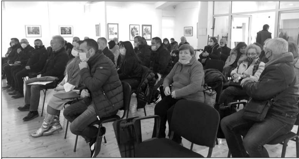
Общественото обсъждане за МБАЛ - Поморие

Това, което е направила Община Поморие в годините, не може да не се отбележи. В болницата се случват събития, за които ОбС-Поморие и кметът са подведени. Ние сме единствената останала малка общинска болница в Бургаско,