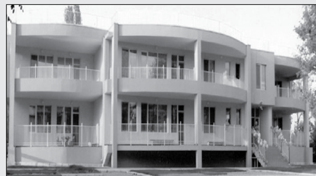
ДГ „Веселушко“ - Поморие

Седемте забавачници в община Поморие са платени, това показва проверката на „Черноморски фар“. Издръжката на целодневните детски градини (ЦДГ) на територията на общината за 2021 г. е в размер на 1 150 651 лева, финансирани със собствени