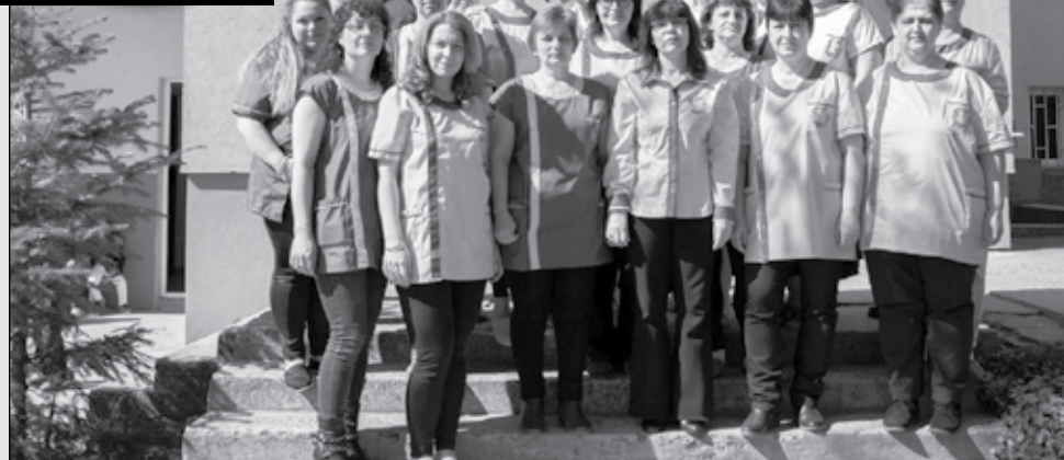
ДГ „Мир“ - Карнобат