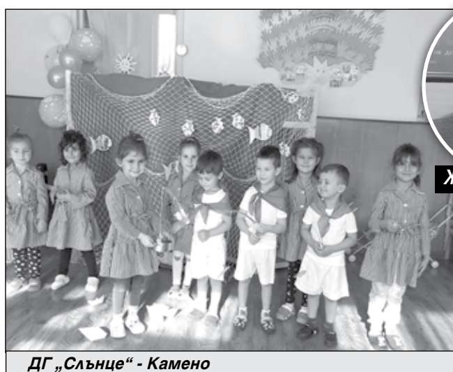
ДГ „Слънце“ - Камено

„Държавните средства са капка в морето. Те са само за заплатите на учителите. Ние си поемаме изцяло всичко останало“, заяви градоначалникът.