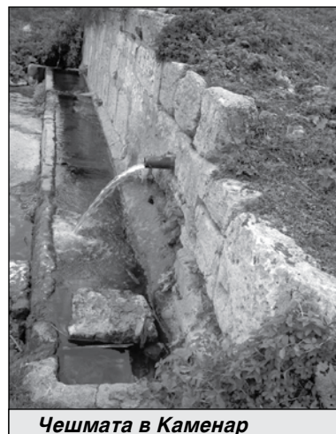
Чешмата в Каменар

„Указанията на проф. Мария Нейкова, бивш областен управител на Бургас, бяха за 25% от населението, ние доказахме, че доста повече желаят това да се случи. Имаме прекрасни дадености. Минерален извор, прочут, предполагам, че и вие сте си пълнили от него.