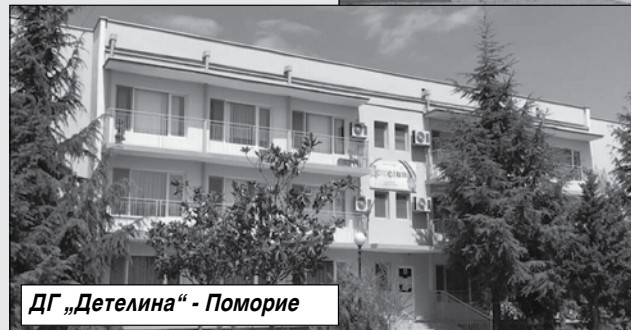
ДГ „Детелина“ - Поморие