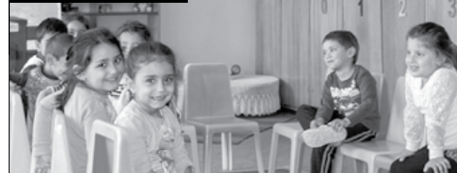
ДГ „Славейче“ - село Чубра