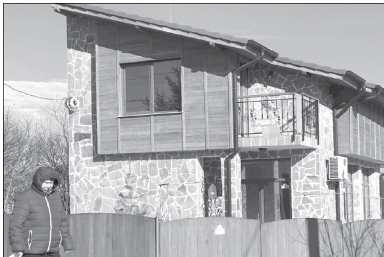
Така изглежда съвременна къща в бъдещия квартал на Поморие