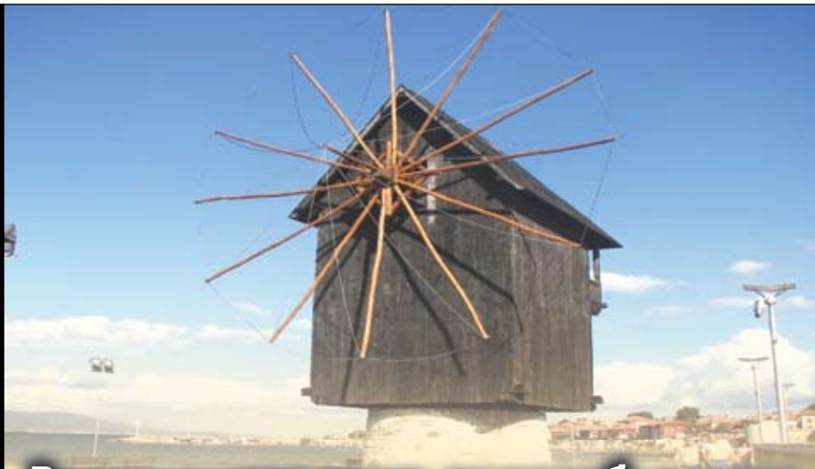
Реставрират една от несебърските емблеми - Ветърната мелница