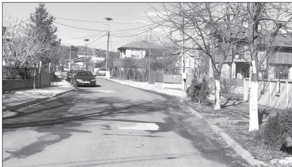
Една от улиците в селото – асфалтирана, пресечна на централната

култивация на старото депо. Сред краткосрочните планове на общинска администрация е превръщането му в модерен парк. Не липсва и идеен проект за изграждане на атракционен парк на мястото на бившата каменна кариера, която е с отпаднала необходимост и е затворена от една година.