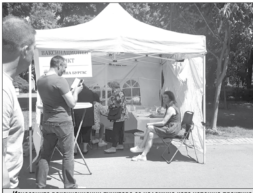
Изнесените ваксинационни пунктове се наложиха като успешна практика

Тъй като, изглежда, ще се провеждат всеки уикенд, ви запознаваме и с работното им време, което е от 9 сутринта до 18 часа следобед.