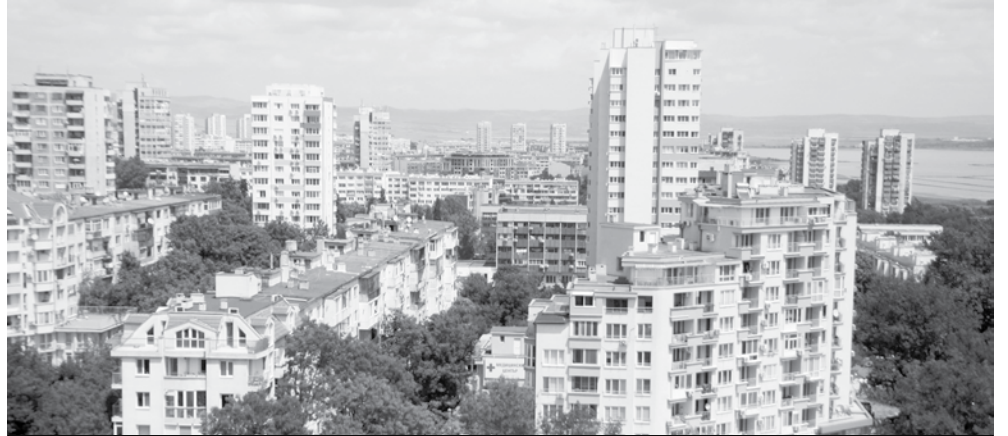
Най-много нови жилища се строят в комплекс „Меден рудник“

„На зелено“ почти не се предлагат жилища в Бургас. „Само в Централна градска част – такива малки бутикови сгради, които се строят ряд-