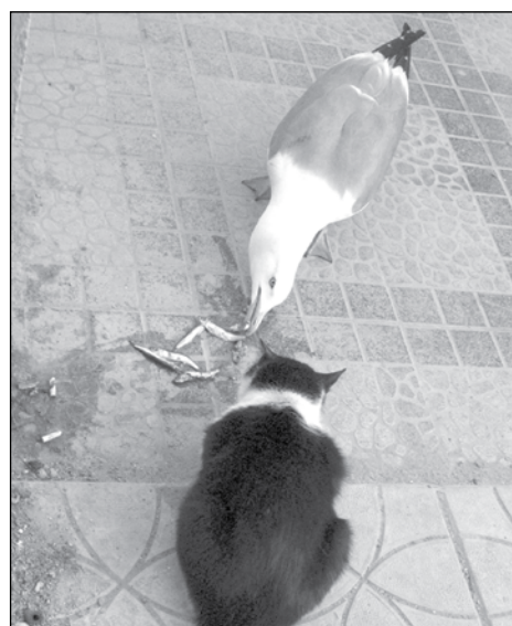
Освен че крадат храна, гларусите са в конкуренция с котките по улиците