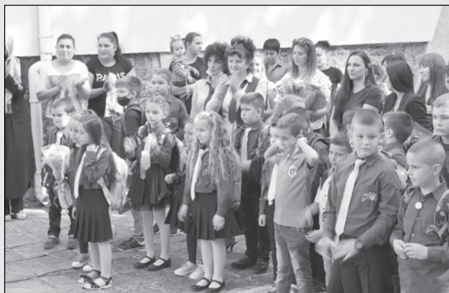
Върху развитието на всички ключови умения у своите възпитаници залагат в ОУ „Светлина“ – село Тополица, екологията е сред приоритетите