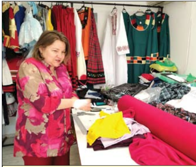
В ателие „Нана“