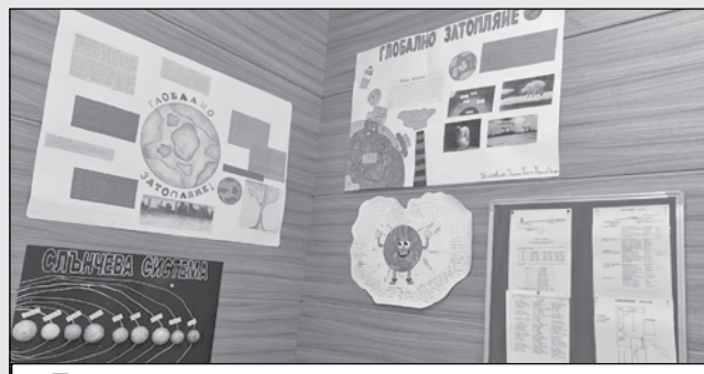
Практическата дейност на тополчанските деца от Месеца на екологията.

включат всички ученици и учители от начален етап и ще бъдат подкрепени от представители на местната общност.