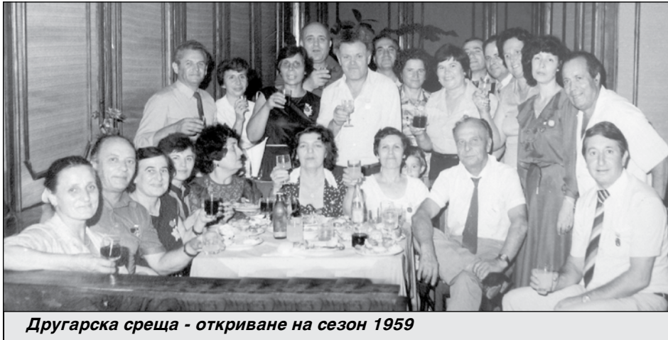
Другарска среща - откриване на сезон 1959

За да се публикува черно на бяло, информацията е била предадена по телефона на 8 юни, вероятно късно вечерта. Подписана е от Тодор Георгиев, който е спецкореспондент на вестника. Към статията има и фотоилустрация, чиито автор е Иван Ковачев. Най-вероятно обаче е публикувана архивна снимка, направена в хода на строителството на хотел „Калина“, в който в действителност е записан първият