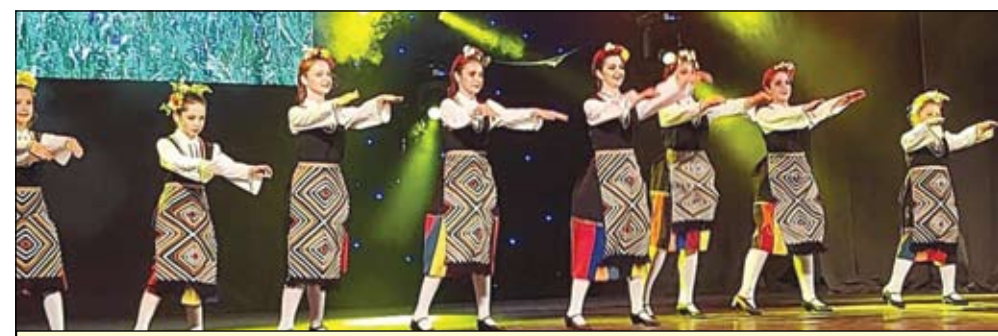
На сцената с костюмите на „Нана“