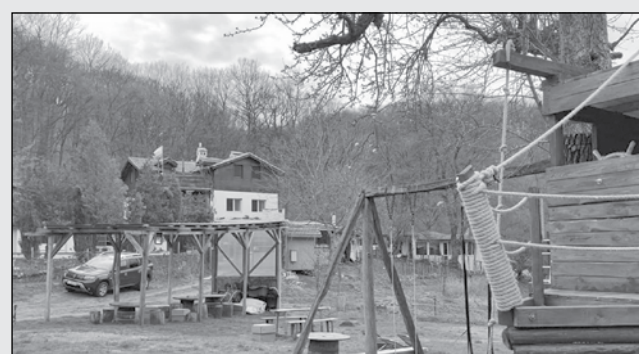
Хижа „Бяла река“ - няма по-прекрасно кътче за отмора, за пряно уловена пъстърва и вълнуващи преживявания за всички възрастни....