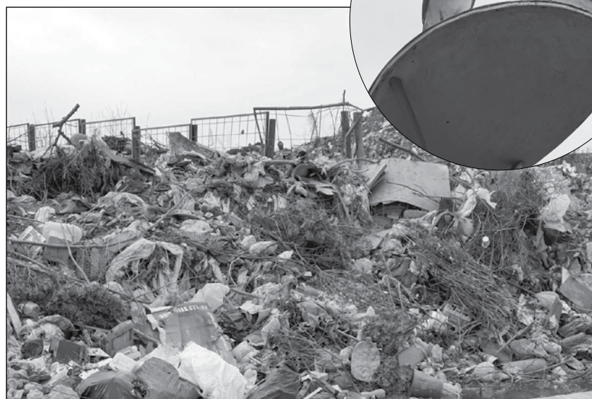
Сметищата във вътрешността на страната привличат птиците

на страната. Причината е същата – където има храна и най-вече сметища, има и гларуси. Читател на „Черноморски фар“, от години живеещ в София, сподели пред наш репортер, че в столицата птица, макар и все още необичайна гледка, се среща. Друг наш читател потвърди това за Пловдив.