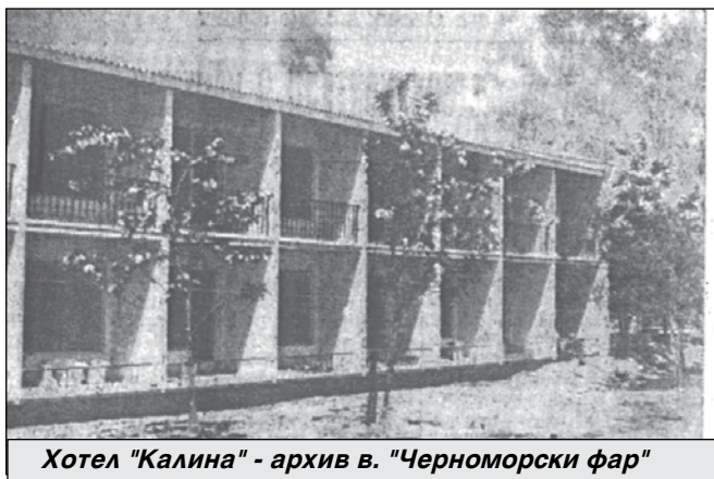
Хотел "Калина"

гат на 8 юни, но официално откриване на сезона е на 12 юни 1959 г.