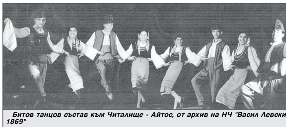
Битов танцов състав към Читалище - Айтос