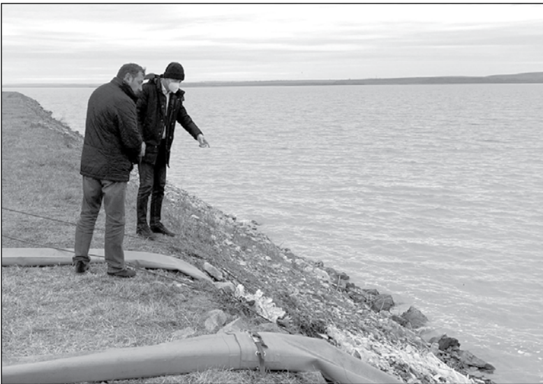
При последните проливни дъждове язовир „Мандра“ наводни Димчево, наложи се да се прави пробив на дигата на река Факийска, за да се оттече водата