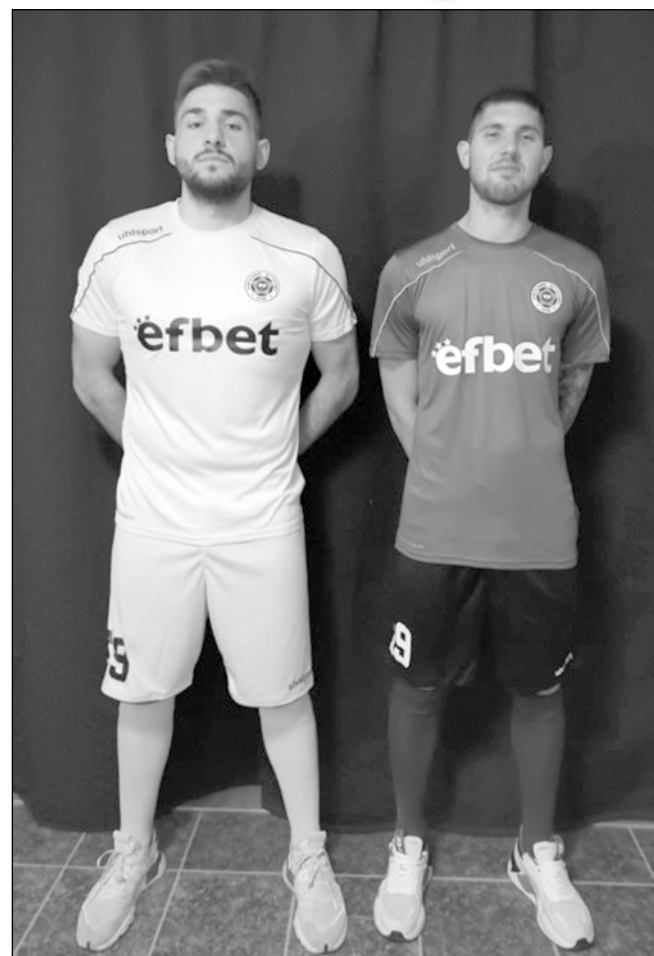
Новите екипи, които играчите ще носят през пролетния полусезон

Ръководството на клуба направи корекция на първоначалния вариант, според който резервното облекло трябваше да е розово. Клубът ще си партнира с популярната фирма „Улшпорт“, а осигуряването на екипировката стана със съдействието на официалния спонсор „Ефбет“.