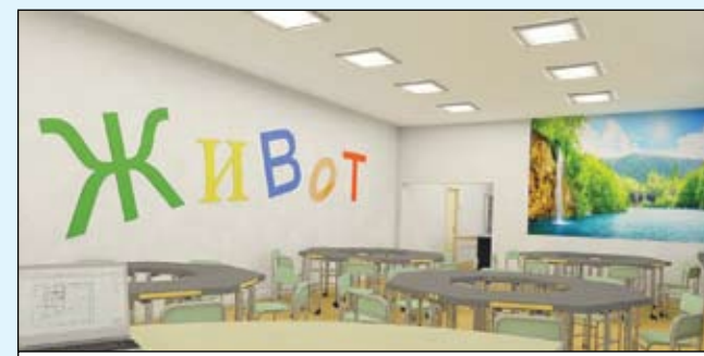
Тематично пространство „Живот“

Предвидени са две пространства за експерименти и изследователска работа под ръководството на учител, четири многофункционални тематични пространства - „Живот“, „Сили“, „Сума“ и „Вещество“, методически кабинет и зона за демонстрации и срещи. Всички помещения ще бъдат свързани помежду си и в същото време ще бъде възможна едновременната работа на най-малко седем различни групи ученици. Тематичното пространство „Вещество“ ще е с размери, които позволяват използването му като лекционна зала с капацитет до 60 души и зона за дискусии, подготовка и анализ на опитите и практическата работа. Освен физическата свързаност между пространствата, се предвижда и свързаност чрез камери, мултимедийни дисплеи и озвучителна система. Планирано е обезпечаване с мебели, които позволяват промяна на позицията на тялото на учениците през време на учебната работа.