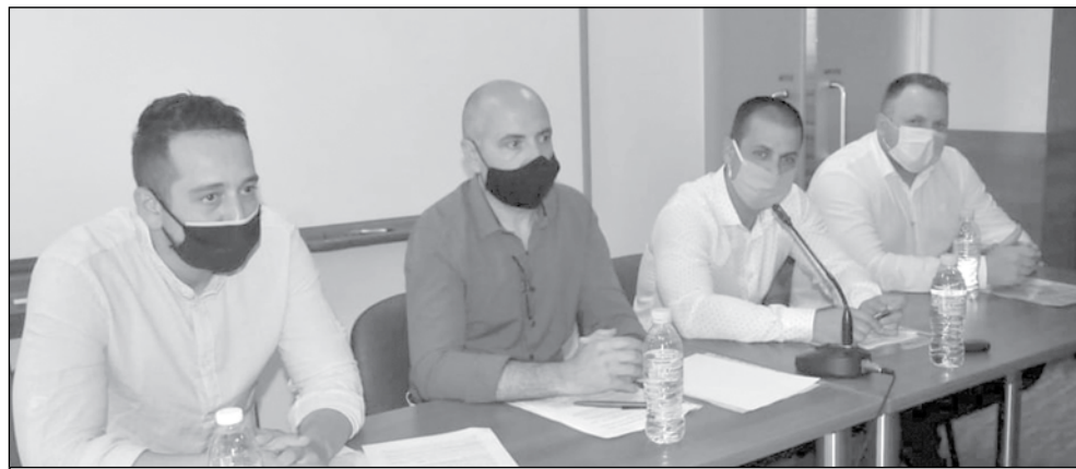
Не спекулирайте с ковид, заявиха от ДБГ

„ДБГ категорично не одобрява взетото решение и мотивите към него, тъй като същите могат да се провеждат безпроблемно при спазване на всички противоепидемични мерки. Ние сме против да се спекулира с настоящото положение, както и да се възпрепятства работата на Общински съвет с несъстоятелни аргументи. Ако се налага пълен локдаун, то нека бъде приложен, но не и да се действат избирателно. Напомняме, че на предстоящата сесия през месец февруари ще бъде обсъждан и гласуван Бюджетът на Община Бургас за 2021 година. За нас е повече от неприемливо това да се случва при подобни условия, които създават предпоставки за съмнения в демократичността на процеса гласуване. Бюджетът е основен инструмент за провеждане на икономическа, финансова и со-