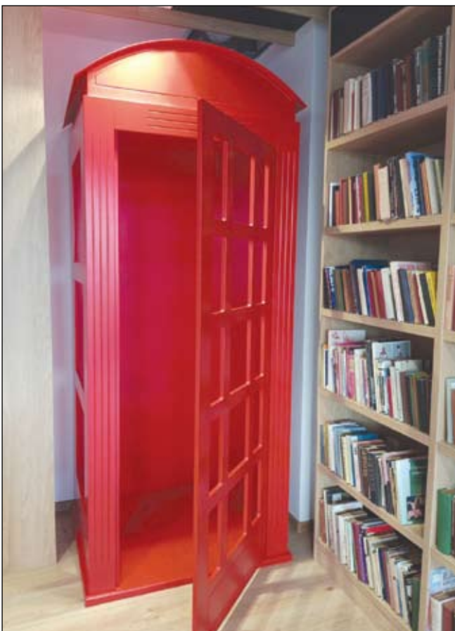
Лондонска телефонна кабина за разговори ще има в новата бургаска библиотека. Тя е в отел „Изкуство“ и ще има специално предназначение