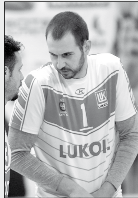
Братоев изпусна нервите си в двубоя срещу „Монтана“

Още тази седмица ще се проведе заседание на Дисциплинарната комисия