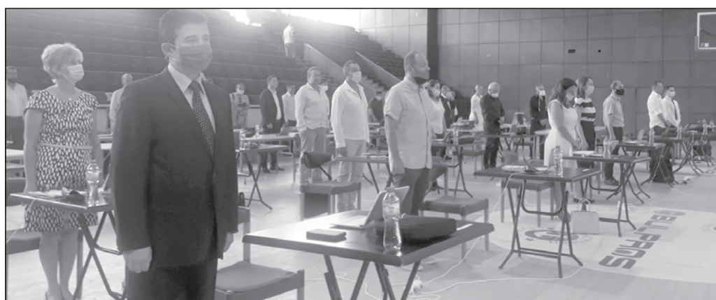
През лятото и до октомври съветниците заседаваха в зала „Бойчо Брънзов“. Сега от опозицията отново настояват за това

От над 1700 желаещи учители в училища и детски градини и непедагогически персонал, записани в предварителните списъци, вече са ваксинирани 1500 души.