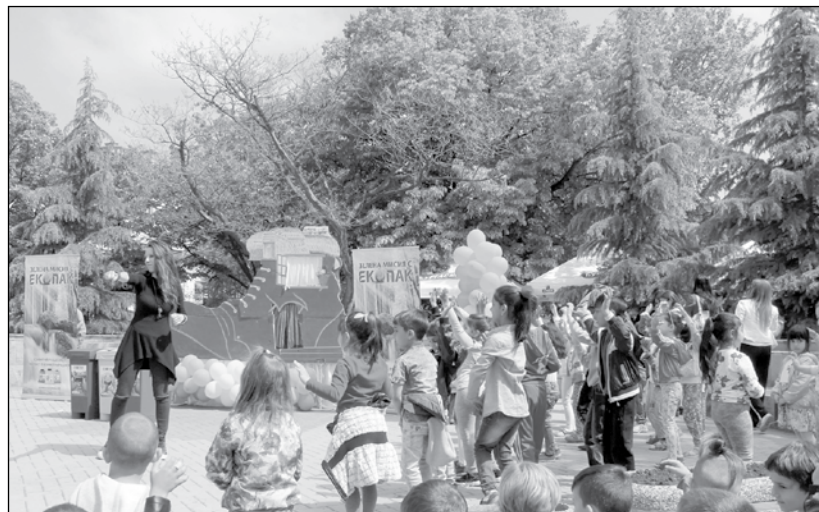
И през 2021 г. основен приоритет са децата и образованието

Трансфери между бюджетни и извънбюджетни сметки.