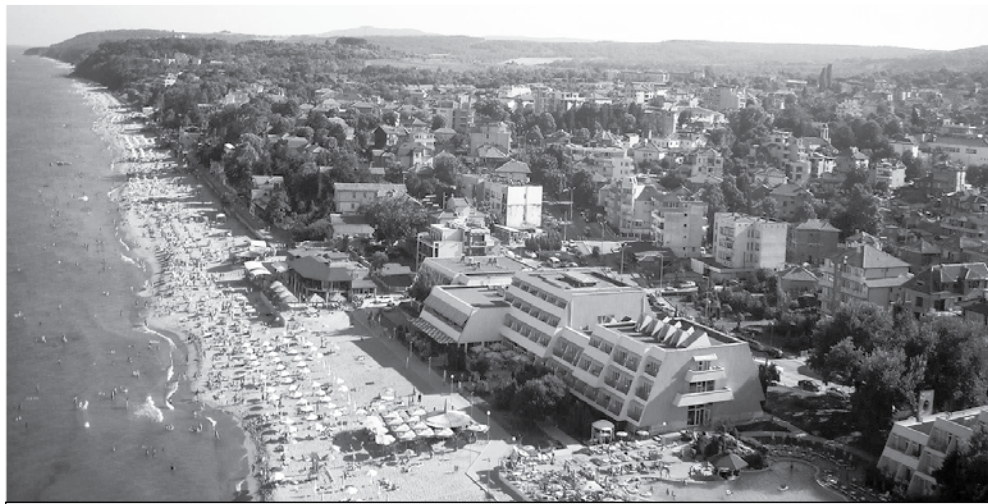
В Обзор има доста ремонти, които ще се състоят с финансиране от Общината