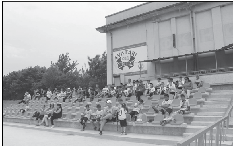
И Спортната зала на стадиона ще бъде основно реновирана

Общата изравнителна субсидия за 2021 г. е в размер на 2 505 700 лева. Ръстът спрямо 2020 г. е 6,34%, в абсолютен размер - 149 300 лв. Средствата за зимно поддържане и снегочистване на общинските пътища са в размер на 176 600 лева, увеличението е с 12 200 лв. в сравнение с 2020 г. Целевата субсидия за капиталови разходи за 2021 г. е 874 100 лева, с 96 400 лв. повече от 2020 година - 12,4 % ръст.