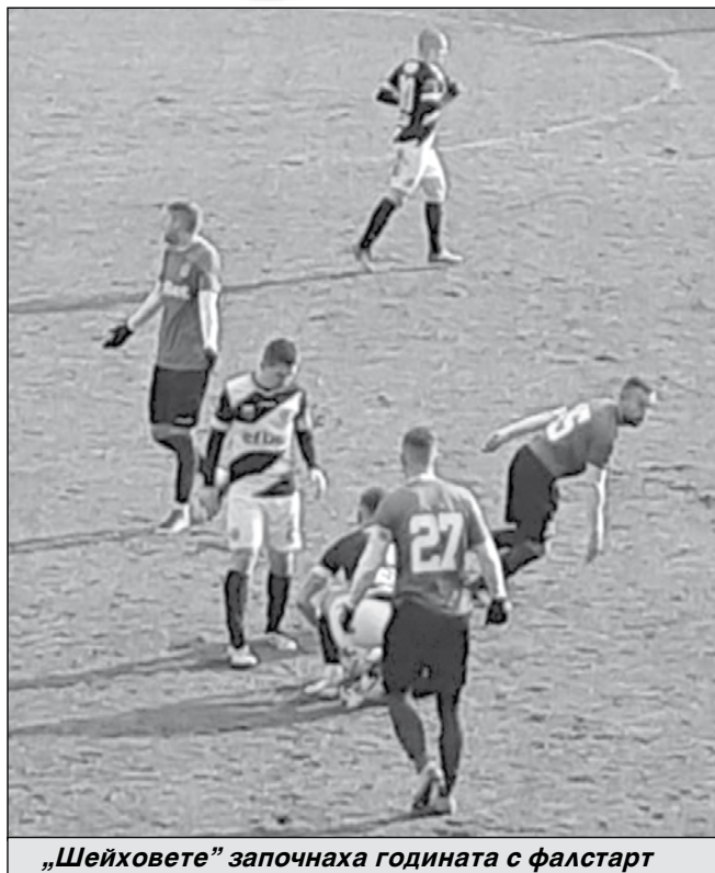
„Шейховете“ започнаха годината с фалстарт

Михаил КОЛЕВ ..... „Нефтохимик“ продължава да затъва във Втора лига. В първия мач от пролетния полусезон „шейховете“ инкасираха загуба с 1:3 при домакин-