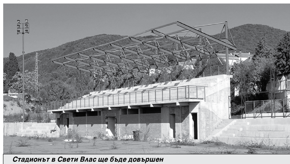
Стадионът в Свети Влас ще бъде довършен

През тази година усилията ще са насочени към: подобряване събираемостта на местните данъци и такси; запазване на финансовата стабилност на общината; оптимизация на разходите; ефективност на публичните ресурси и др. През 2021-ва се запазват данъчните ставки за общинските данъчни приходи – патентен данък, данък върху превозни средства, данък недвижими имоти, данък върху превозните сред-