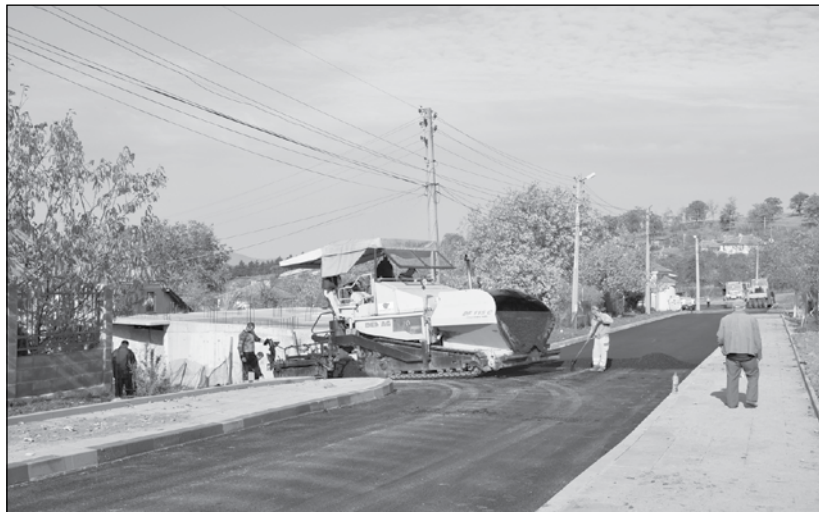
Бюджет 2021 - нови улици и тротоарни настилки в града и селата

Планираните данъчни приходи за бюджет 2021 г. са 1 597 500 лева , или с 25 000 лв. по-малко от Бюджет 2020 г. Постъпленията от данък върху недвижимите имоти са разчетени да бъдат със 70 000 лева по-малко от предходната година. Намалението е вследствие намаляване на данъка за жилищните имоти. В проекта за Бюджет 2021 г. са заложен 230 000 лева приходи, при план за 2020 г. - 300 000 лв. Малко по-високи са очакванията за приходите от данък върху пре-