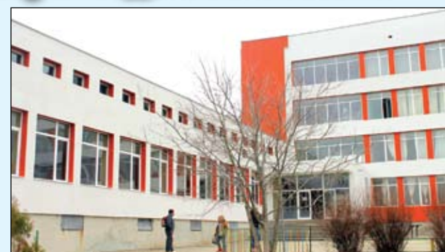
СУ „Никола Вапцаров“ - Айтос

Центърът по природни науки, изследвания и иновации ще обхваща общо 9 помещения - четири учебни стаи, три хранилища, коридор и фойе, разположени на един етаж и обособени в отделно крило. Центърът ще бъде на последния етаж на сградата, за да е възможно спазването на специфичните изисквания за помещения, в които се провежда учебна работа по природни науки. Те ще са свързани така, че да бъдат обединени в нова образователна среда, която ще обхваща шест режима на учене.