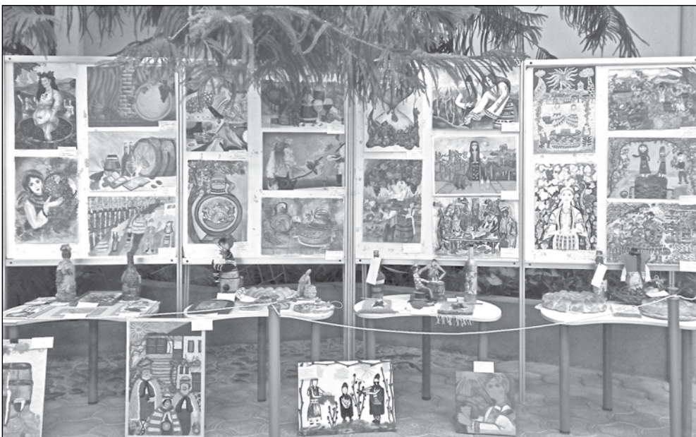
Работи на участници в XVIII Национална изложба-конкурс „Свети Трифон Зарезан - 2021г.“, Сунгурларе

в Поморие дадоха някакви резултати, но недостатъчни, по техни думи. Реколтата им успя донякъде да се реализира, благодарение на закупвачите от Варна, Добрич и отчасти Бургас, които бусове бяха топлата връзка между гроздето и всички мераклии да си произведат вино в домашни условия. Годината наистина бе като увеселително влакче – за едни на ужасите, за други – повод за усмивка.