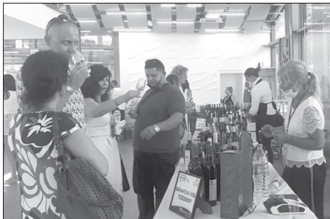
През годините Wine&Spirit Fest Burgas се утвърди като форум, който насърчава към избор на качествени вина и спиртни напитки

Това, което е започнато като кризисни мерки, е добре като основа, категорични са лозарите, но не е дос-