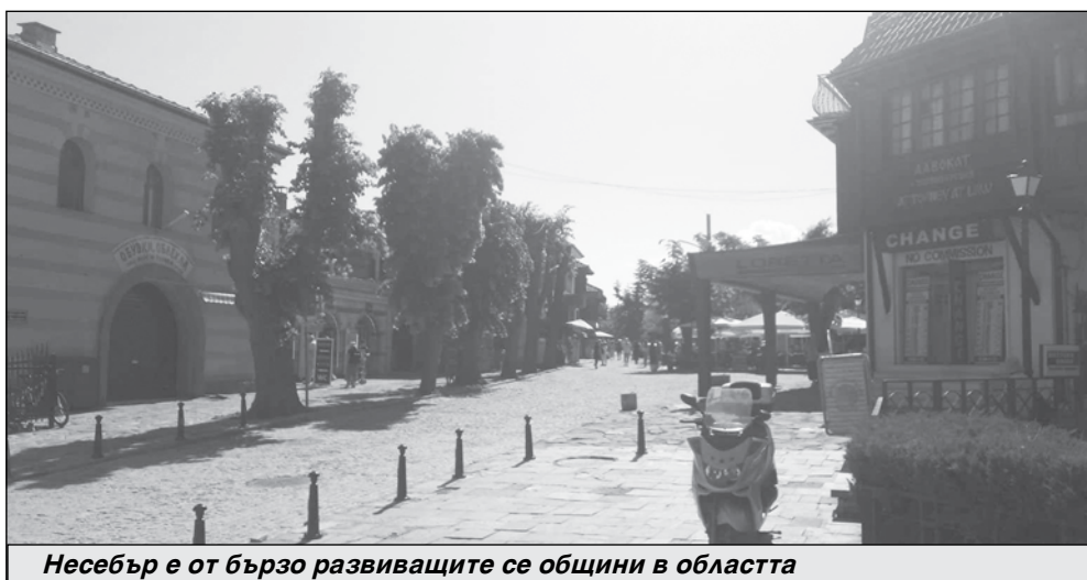
Несебър е от бързо развиващите се общини в областта

1300 души – 28 968, а в Айтос са 27 632. На трето място, много близо до Айтос, е Руен с 27 593 души. Поморие е следващата по-голяма община с 27 263 души население. Малко Търново остава общината с най-малко население – 3097 жите-