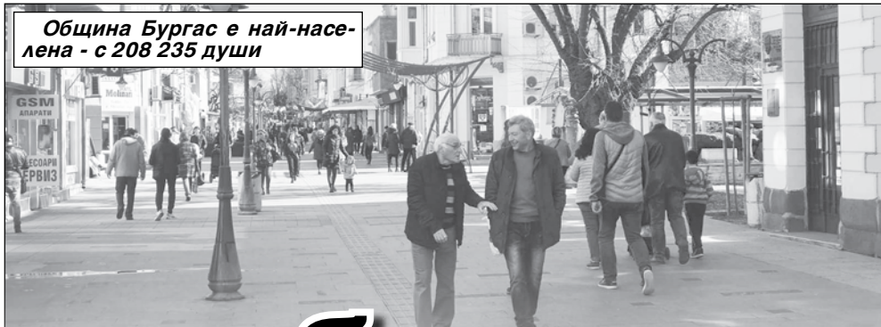
Община Бургас е най-населена - с 208 235 души