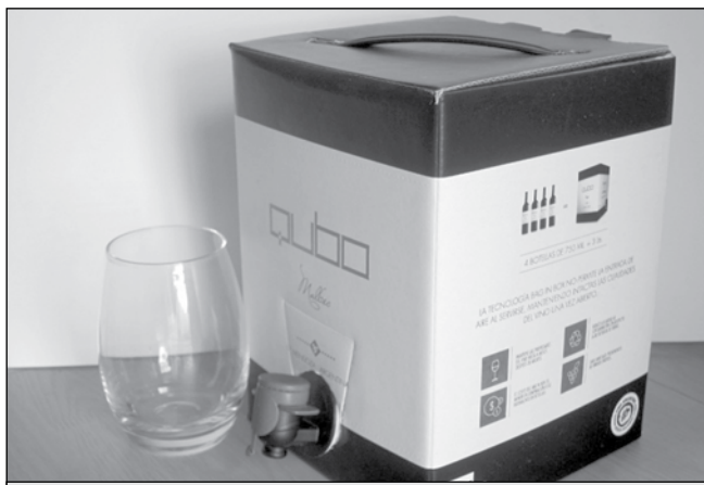
Вината от бег-ин-бокс са предпочитани за домашна консумация, сега, когато заведенията са затворени, категорични са винопроизводителите

„Силна неудовлетвореност на лозарите идва от ниските цени на гроздето и де-