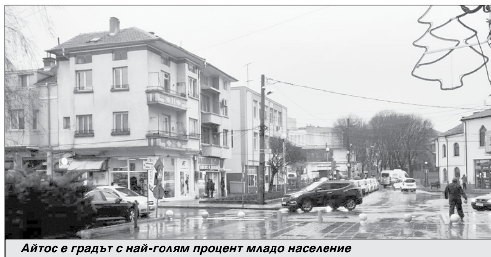
Айтос е градът с най-голям процент младо население