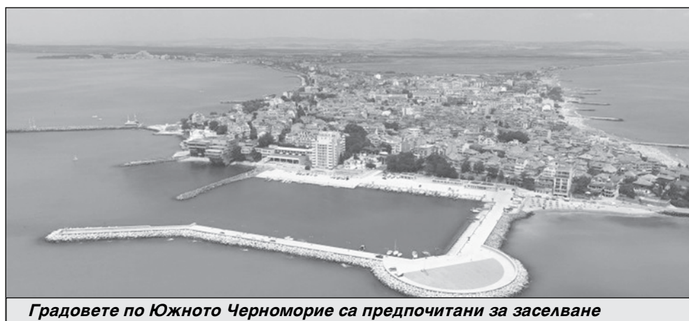
Градовете по Южното Черноморие са предпочитани за заселване

Ако проявявате интерес към позицията, моля да ни изпратите автобиография на iffavorit@abv.bg