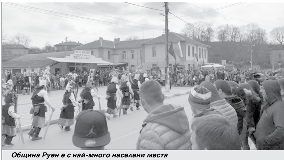
Община Руен е с най-много населени места

Цифрите от естествен прираст на населението в областта са тревожни. Само община Руен отбелязва положителен такъв. Този коефициент се измерва в промили (на 1000 души) и